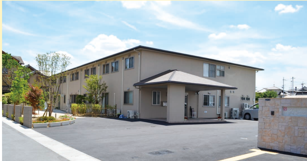
ファミリーモア八重桜宝来館（デイサービス付き高齢者住宅）と特別養護老人ホームとの入居メリットの比較